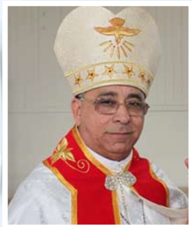
BISHOP BOSCO PUTHUR (Apostolic Visitor to the Syro-Malabar in New Zealand)